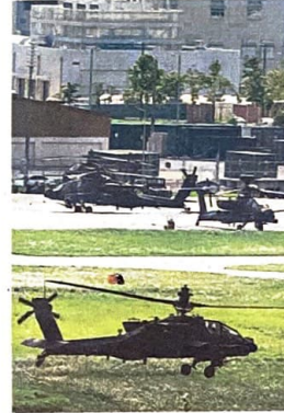
Helicópteros apaches de EE UU

A finales de julio, Kim dijo que el país estaba «listo para movilizar» su fuerza nuclear disuasoria. Hace apenas unas semanas que el territorio declaró su victoria contra el coronavirus, un anuncio que muchos analistas interpretaron como aviso de que el territorio estaba preparado para retomar sus pruebas militares. La hermana y mano derecha del mandatario señaló como culpable del estallido de la pandemia a Corea del Sur y amenazó con «represalias mortales». A pesar de las tensiones, el presidente surcoreano, Yoon Suk Yeol, ha dicho estar dispuesto a proporcionar ayuda económica a su vecino si éste comienza la desnuclearización. Pyongyang ha rechazado tajantemente la propuesta: Yoon debería «cerrar la boca».