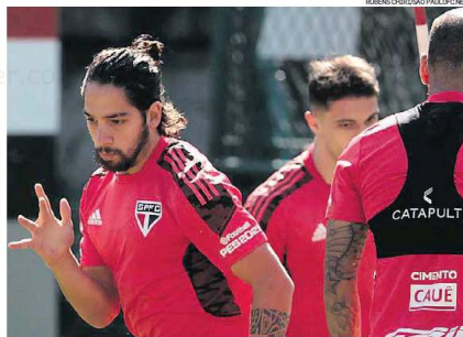
Maestro. O argentino Benítez tem sido o principal jogador do São Paulo