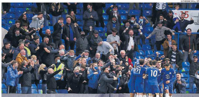
Matando a saudade. Torcedores do Chelsea comemoram gol do time: Stamford Bridge recebeu 8 mil pessoas na terça