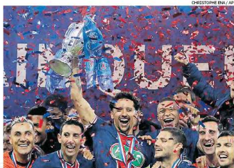
Dia de festa. PSG ganhou o primeiro título na temporada

Em um confronto tático interessante, o Monaco foi valente, fez de tudo para não perder e tentou o empate de diversas maneiras, mas estava pouco inspirado na criação das jogadas e quase não incomodou o goleiro Navas na etapa inicial. Na volta do intervalo, o técnico Niko Kovač colocou Jovetic e Gelson Martins em campo a fim de deixar a sua equipe mais ofensiva, mas não deu certo.