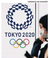
Esforço. Tóquio trabalha para fazer Jogos seguros

De acordo com Thomas Bach, o COI está pronto para fornecer pessoal médico adicional para o Japão durante a disputa dos Jogos Olímpicos, já que