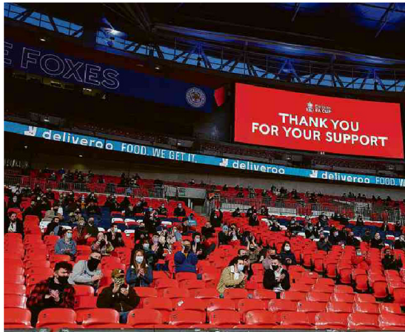
Torcedores no estádio de Wembley em jogo da Copa da Inglaterra que marcou a volta do público para os estádios do país, ainda que em período de testes