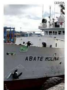
EL BARCO ESTARÁ EN EL NORTE.