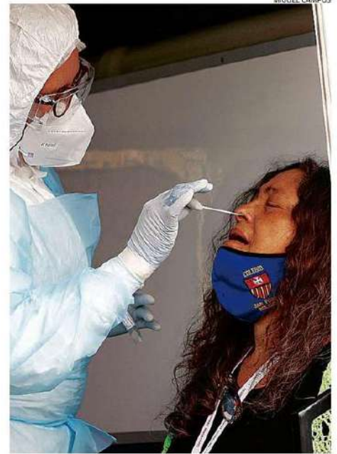
LLAMAN A TESTEARSE EN CASO DE SINTOMAS O CONTACTOS DE RIESGO.

"Tras ocho semanas con bajas consecutivas de los casos en la región y en el país, vemos con preocupación que en al menos 11 regiones, los casos han empezado a subir, y que la de Valparaíso, lamentablemente, no es excepción. (...) Nosotros no queremos retroceder en las libertades, pero tampoco ver expuesta a la población un mayor riesgo de hospitalización