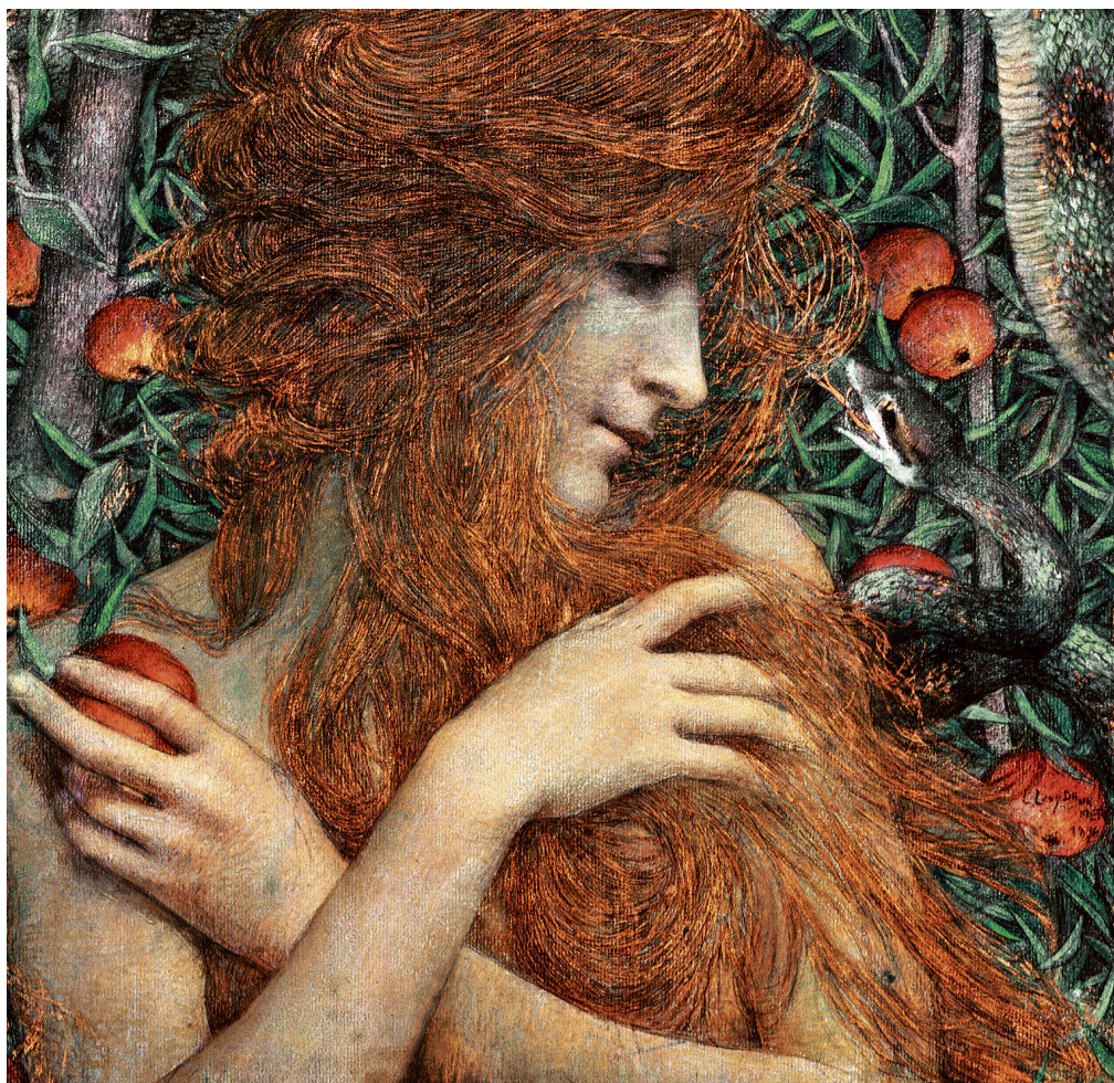
Eva greift nach dem Apfel: Über Jahrhunderte war dies der Beweis für die Sündhaftigkeit der Frauen.