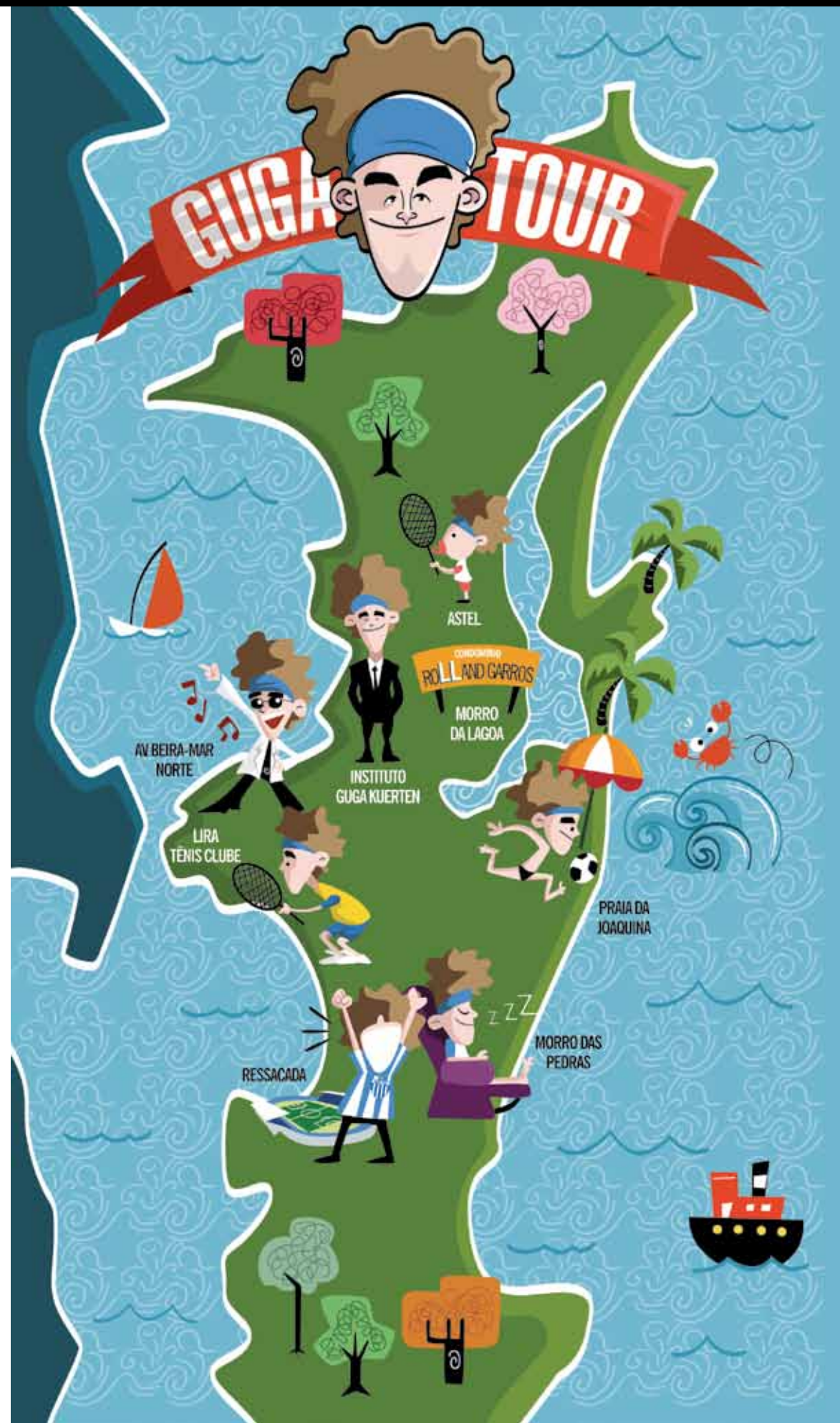
ACERVO/IGK - ILUSTRAÇÃO DO TIAGO

Em Florianópolis, Guga é rei, mas consegue cultivar sua realeza de um jeito tranquilo. Aqui você conhece o roteiro do nosso “Guga Tour”, mas com a condição de que o cidadão mais ilustre e mais discreto de Floripa continue vivendo em paz.