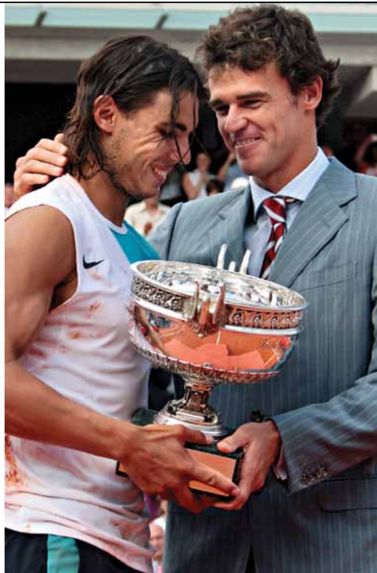
(GUGA E NADAL); (AVAÍ); (GUGA E FAGNER)