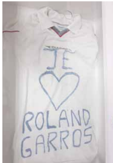
O memorial montado no escritório do tenista reúne lembranças da sua vida dentro e fora das quadras, de cadernos de escola a uniformes, troféus e lembranças de quando começou a jogar tênis. Não haveria lugar melhor para ele se casar