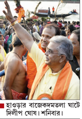
হাওড়ার বাজেকদমতলা ঘাটে দিলীপ ঘোষ। শনিবার।

নিজস্ব প্রতিনিধি, বিষ্ণুপুর ও কলকাতা, ২ নভেম্বর: পাকিস্তানের চক্রান্তের জেরেই কাশ্মীরে বাঙালিদের হত্যা করা হচ্ছে। শনিবার দক্ষিণ ২৪ পরগনার বিষ্ণুপুরে এমনটাই অভিযোগ করলেন দিলীপ ঘোষ। রাজ্য বিজেপি সভাপতি এদিন বলেন, 'ভুল বুঝিয়ে কাশ্মীর থেকে বাঙালিদের এ রাজ্যে ফেরানো হচ্ছে। আমরা সবরকম চেষ্টা করছি যাতে কাশ্মীরে সুস্থ পরিবেশ বজায় থাকে।