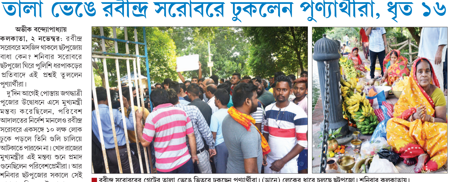
রবীন্দ্র সরোবরের গেটের তালা ভেঙে ভিতরে ঢুকছেন পুণ্যার্থীরা। (ডানে) লোকের ধারে চলছে ছটপুজো। শনিবার কলকাতায়।