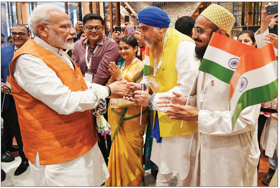
ব্যাংককে পৌছানোর পর প্রধানমন্ত্রী নরেন্দ্র মোদিকে অভ্যর্থনা জানাচ্ছেন প্রবাসী ভারতীয়রা। শনিবার।