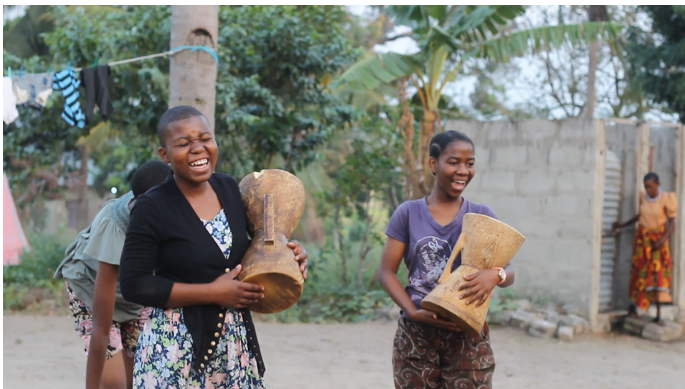
Tempo Zawose, documentário da diretora Lwiza Ganibal

✉ (mailto:?Subject=In-Edit+Brasil%3A+uma+janela+para+o+mundo+musical&Body=https%3A%2F%2Frevistatrip.uol.com.br%2Ftrip%2Fin-edit-brasil-uma-janela-para-o-mundo-musical) Em Afro-Sampas , de Jasper Chalcraft e Rose Satiko Hiji, o foco é um aspecto pouco explorado quando se fala de migrantes africanos em São Paulo: a contribuição musical. O filme retrata uma metrópole multicultural que, diferente de outras cidades do mundo onde migrantes vivem entre os pares, permite a mistura dos artistas africanos com o entorno.